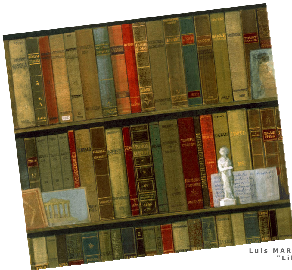
Luis MARSANS "Libros" 1991. Technique mixte sur carton, 43 x 48 cm.

T echniques mixtes : En dessin et en peinture, utilisation de différentes techniques au sein d'une même œuvre : encre, aquarelle et crayon à la cire, par exemple, que l'on peut aussi associer à la technique du collage