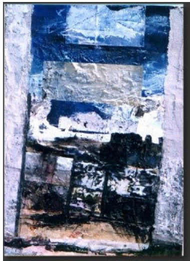
Mirages - 1995/1998 technique mixte sur toile 130cm X 97cm acrylique avec marouflage de papier de chine - crayons

Aujourd'hui c'est aussi une technique picturale attribuée au mouvement DADA.